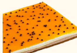
Plancha San Marcos

C-24/ Ref: 302421 C-30/ Ref: 302121 C-48/ Ref: 302221