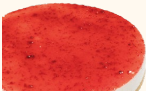
Tarta de queso fresa con base de galleta