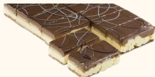
Pastel Abuela galleta

Ref: 302739 Peso: 1.100 g Tamaño: 27 x 18 x 4 cm Uds./ caja: 1