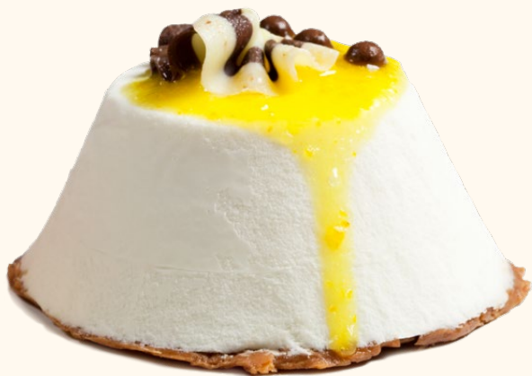
Volcán de limón con crujiente de chocolate