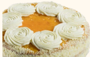
Tarta naranja y lima