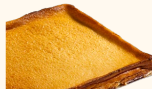
Pastel de queso

Ref: 302034 Peso: 1.800 g Tamaño: 36 x 27 x 2,5 cm Uds./ caja: 1 C-24/ Ref: 302434 C-30/ Ref: 302134 C-48/ Ref: 302234