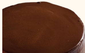
Tarta de galleta con chocolate