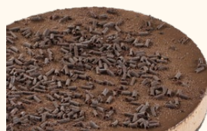
Mousse de chocolate con base de galleta