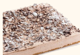
Plancha de chocolate

C-24/ Ref: 302412 C-30/ Ref: 302112 C-48/ Ref: 302212