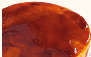
Tarta de galleta con caramelo