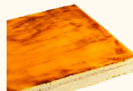
Plancha de crema catalana

C-24/ Ref: 302414 C-30/ Ref: 302114 C-48/ Ref: 302214