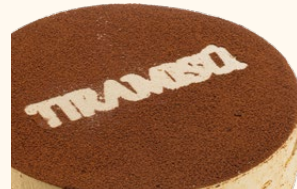
Tarta de Tiramisú