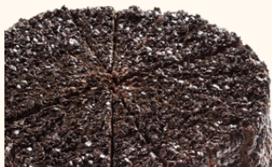
Tarta muerta por chocolate C-18