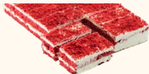
Pastel red velvet

Ref: 302739 Peso: 1.100 g Tamaño: 27 x 18 x 4 cm Uds./ caja: 1