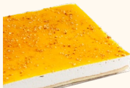
Plancha de whisky

C-24/ Ref: 302418 C-30/ Ref: 302118 C-48/ Ref: 302218