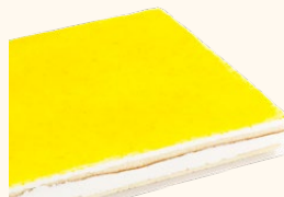
Plancha de queso limón

C-24/ Ref: 302413 C-30/ Ref: 302113 C-48/ Ref: 302213