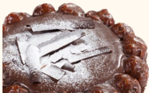
Tarta bavarois de avellana