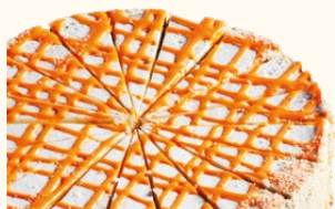
Carrot cake C-18