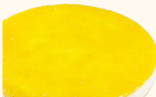
Mousse de limón con base de galleta