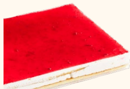
Plancha de queso fresa

C-24/ Ref: 302410 C-30/ Ref: 302110 C-48/ Ref: 302210