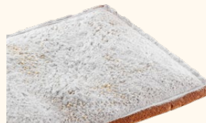
Pastel de almendra

Ref: 302033 Peso: 1.800 g Tamaño: 36 x 27 x 2,5 cm Uds./ caja: 1 C-24/ Ref: 302433 C-30/ Ref: 302133 C-48/ Ref: 302233