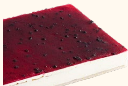
Plancha de queso arándanos

Tamaño: 36 x 27 x 4 cm Uds./ caja: 1 TAMAÑO | C-24 Tamaño: 6 x 6,75 x 4 PORCIONES | C-30 Tamaño: 6 x 5,4 x 4 CORTADAS | C-48 Tamaño: 4,5 x 4,5 x 4