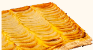
Pastel de manzana

TAMAÑO | C-24 Tamaño: 6 x 6,75 x 4 PORCIONES | C-30 Tamaño: 6 x 5,4 x 4 CORTADAS | C-48 Tamaño: 4,5 x 4,5 x 4