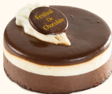
Festival de chocolates