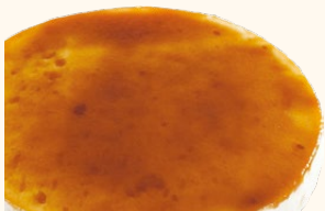
Tarta de orujo