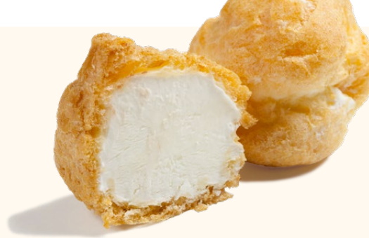
Profiteroles de nata