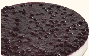
Tarta de queso arándanos con base de galleta