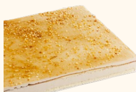
Plancha de turrón

C-24/ Ref: 302411 C-30/ Ref: 302111 C-48/ Ref: 302211