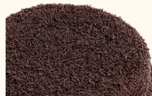
Tarta de chocolate brigadeiro